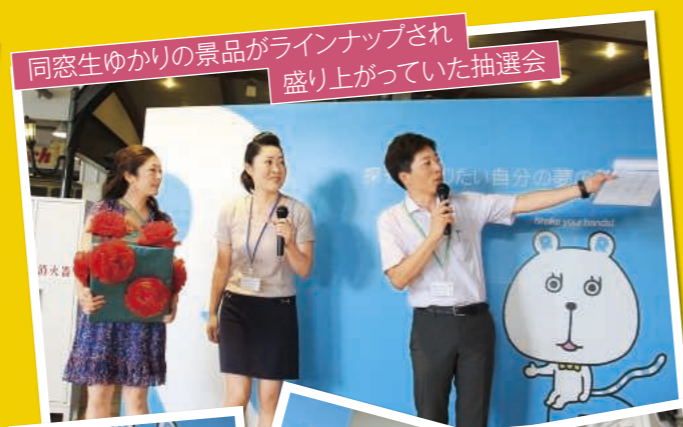
同窓生ゆかりの景品がラインナップされ 盛り上がっていた抽選会