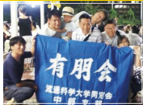
屋上ビアガーデンで 乾杯!人数は少なくても 盛り上がり度は負け ません!?