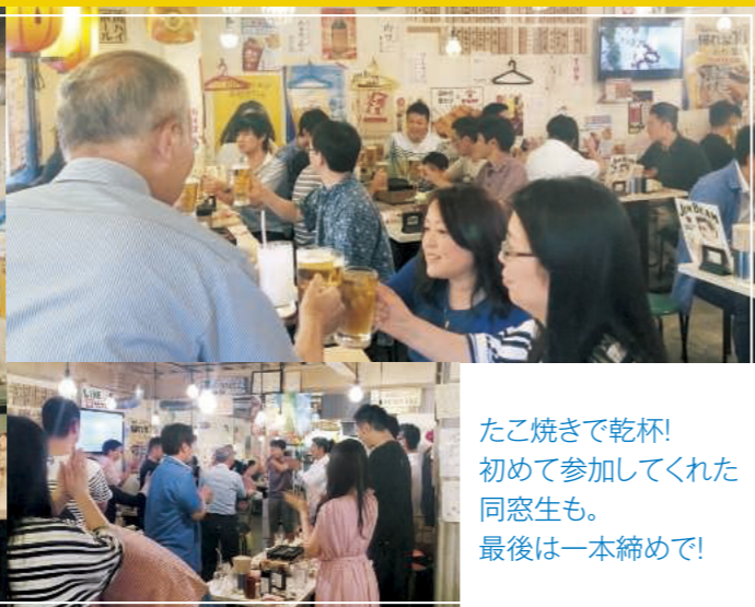
たこ焼きで乾杯! 初めて参加してくれた 同窓生も。 最後は一本締めで!