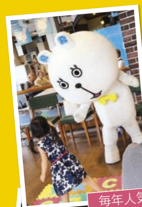
毎年人気のちびっこ広場