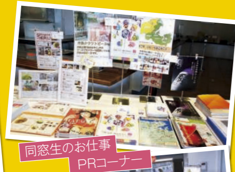
同窓生のお仕事 PRコーナー