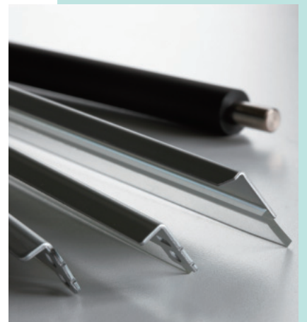
複写機などに組み込まれる部品

同窓生との交流といえば、親しい同期生とたまに食事に行くくらいですが、この春から神戸勤務になり、先日同期生とポートライナーではったり会って驚きました。有朋会の活動に参加したことはありませんが、神戸に戻ってきたのを機に有朋会を出会いの